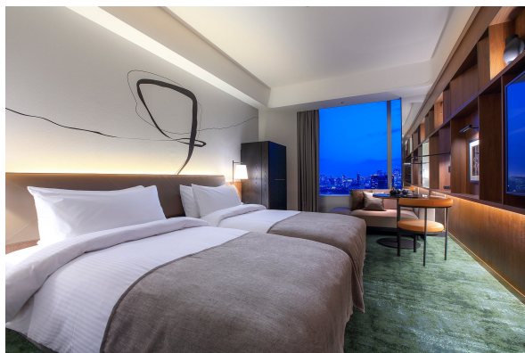
エグゼクティブルーム ツイン (パレスサイド)