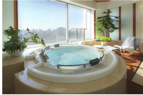
ロイヤルドームスイート・バスルーム

バスルームの床には大理石を用い、木製デッキで囲まれたジャグジーからは皇居、遠く富士山まで見渡すことができます。