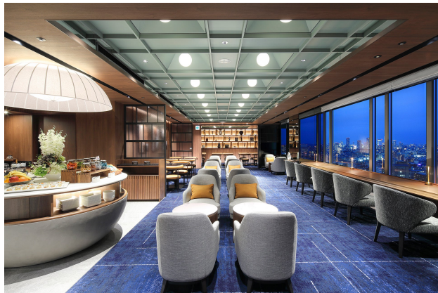
エグゼクティブラウンジ

詳細はこちらをご覧ください。URL： https://www.tokyodome-hotels.co.jp/tokyoretreat/