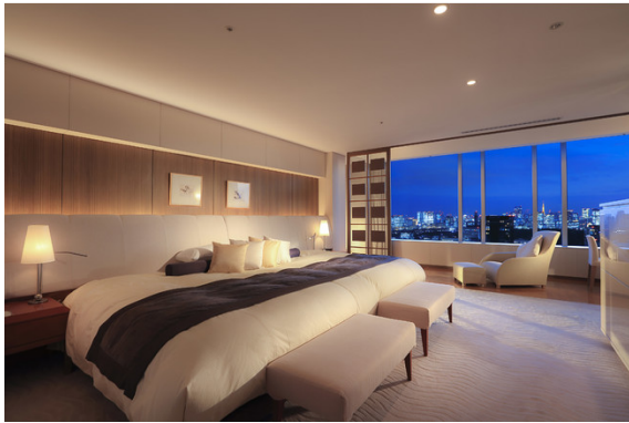
ロイヤルドームスイート・ベッドルーム