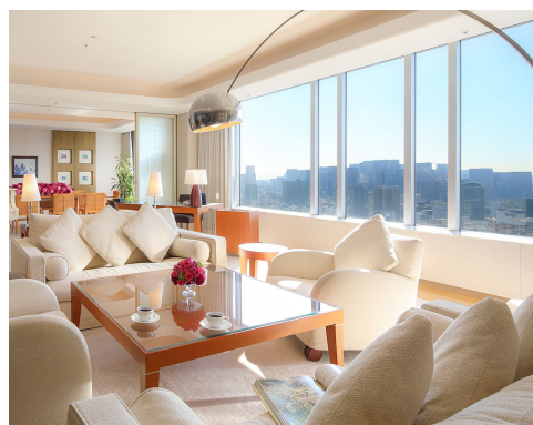
ロイヤルドームスイート・リビングルーム

フォーマルな中にも家庭的な温かさを感じさせる室内は、オフホワイトの布張りのソファやダークブラウンの木目の家具など、落ち着いた雰囲気にあふれています。ベッドはハリウッドツインタイプをご用意。