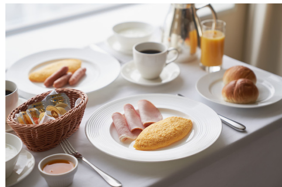
アメリカンブレックファストイメージ