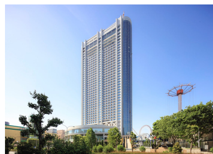
東京ドームホテル外観