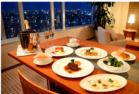
ディナーフルコースイメージ