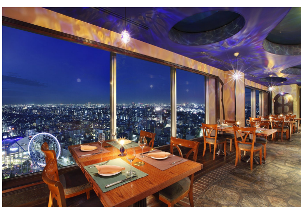
スカイラウンジ&ダイニング「アーティスト カフェ」店内

大晦日の夜には“年越しそば”、元旦のご朝食には“おせち料理”をご提供いたします。心ゆくまで当ホテルの美食、絶景、おもてなしをご堪能ください。