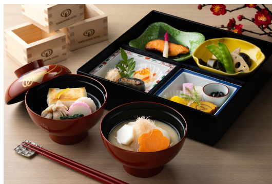
元旦のご朝食“おせち料理”イメージ

また、会場内ではお正月を彩る伝統芸能“寿獅子舞”や“琴の演奏”をお楽しみいただけるほか、“振る舞い酒”をご提供いたします。