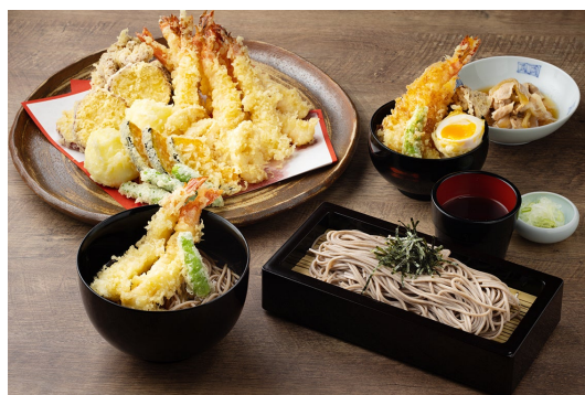
年越しそばイメージ

大晦日には、ホテルの宴会場で年越しそばを。海老、舞茸、さつまいも、かぼちゃなどの天麩羅や、ミニ天井、牛しぐれ煮もご用意し、温かいお蕎麦・冷たいお蕎麦をお好みでお選びいただけます。