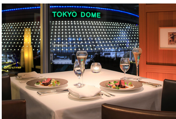
ダイニング「ドゥ ミル」店内

ホテルシェフが手掛ける本格フレンチ、地上 150mの絶景と共に味わうイタリアンなど5つのレストランよりご夕食をお選びいただけます。