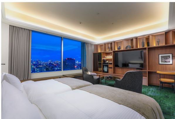
客室例：エグゼクティブスイート C（パレスサイド）

ホテルシェフが手掛ける本格フレンチ、地上 150mの絶景と共に味わうイタリアンなど5つのレストランよりご夕食をお選びいただけます。