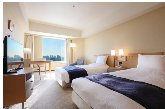
客室例：スタンダードツインルーム

広々とした客室で年末年始の大切な時間を快適にゆったりとお過ごしください。客室タイプはスタンダードルームからスイートルームまでお選びいただけます。1 年の疲れを癒す至高のひとときを。