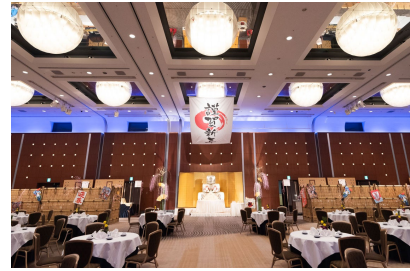
元旦特別会場イメージ

※お問い合わせ受付時間 : 平日・土曜 9:00~21:00 / 日曜・祝日 9:00~18:00