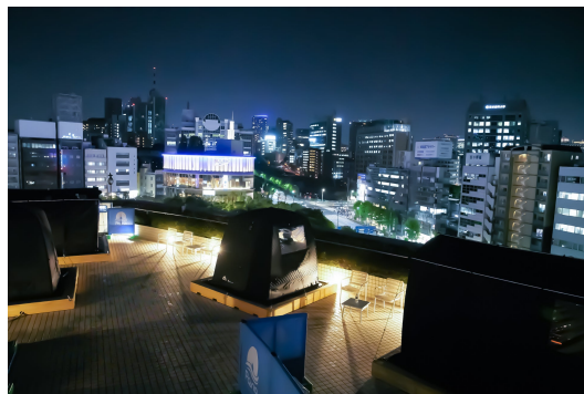
プールサイドサウナ「Poona」イメージ

セルフrouyuセット / バスローブ / バスタオル / フェイスタオル / サンドル / ミネラルウォーター