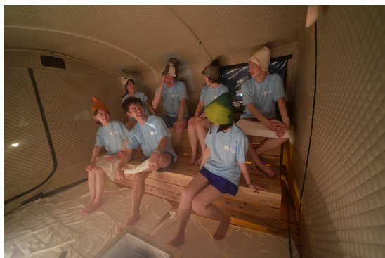
テントサウナ内イメージ