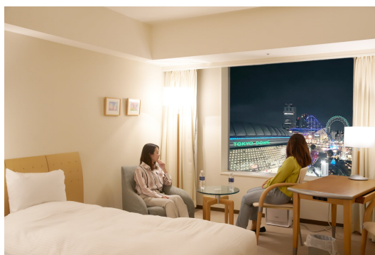
ホテル客室内イメージ

プールサイドサウナ「Poona」を満喫した後は、お部屋でゆっくりとお過ごしいただける宿泊プランがおすすめです。滞在中、日頃の疲れを癒しながら、極上のリフレッシュ体験をご提案いたします。