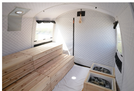
MORZH MAX テント内イメージ