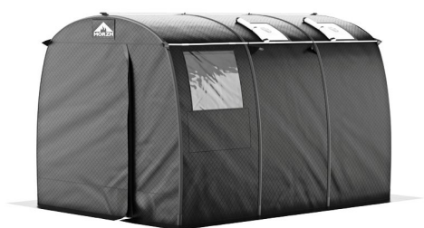
MORZH MAX（定員8名様）イメージ

アウトグースもお楽しみいただける広々とした空間に、本格的な2段式ベンチをご用意。ご友人やサウナー仲間などグループにもおすすめのテントサイズです。