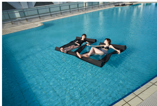
水上ハンモック（リラもっく）を使用した 浮遊浴イメージ

高性能でセルフフローリュ可能なテントサウナ、都心の開放感あふれる外気浴と合わせて、プールを水風呂代わりにした浮遊浴で極上の“ととのう”体験。非日常のプライベートサウナを存分に満喫していただけます。アクセスも抜群な環境にあるため、会社帰りやお仲間同士の集まりに気軽にテントサウナをご利用いただけます。個人予約はもちろん、団体予約を有効にご活用いただくことで、都心のテントサウナ&ホテルプールをプライベート空間としてご利用いただくことが可能です。