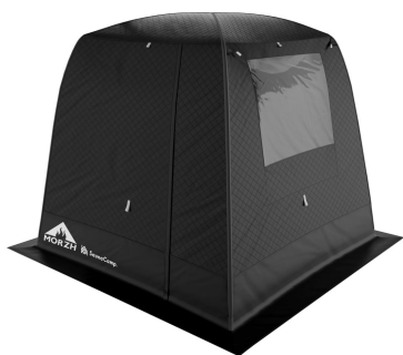
MORZH（定員4名様）イメージ

断熱性の高い3層式のテント。大きな窓からは、晴れていれば陽の光がテント内に差し込み、夜は夜景を眺めながらサウナをお楽しみいただけます。少人数でご利用いただけるテントサイズです。