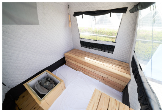
MORZH テント内イメージ