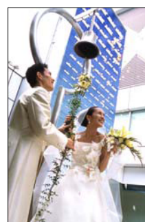
上：光のチャペル 左：パティオ