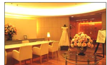
ウェディングサロン