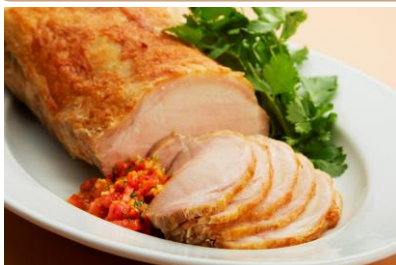
ローストポーク メキシカンサルサ添え 【ランチ・ディナー共通】