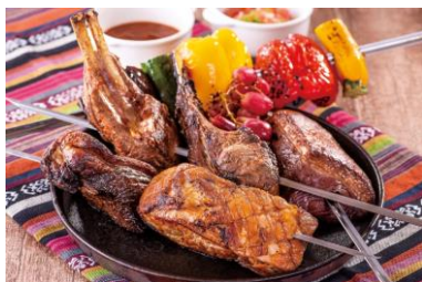
チュラスコ各種 （ピカーニャと野菜・骨付き仔羊と野菜・黒豚ロースと野菜）