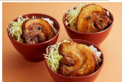
炙りチャーシュー丼 【ランチ限定】