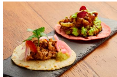
タコスセット （ソフトシェルクラブとアボカドのタコス・牛スジのタコス）