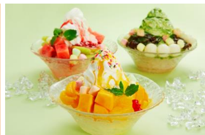
ふわふわミルクかき氷 【ランチ・ディナー共通】