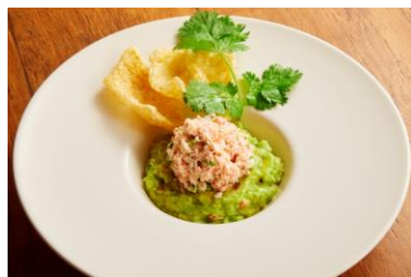
紅ズワイ蟹サラダ&ワカモレ チチャロン添え