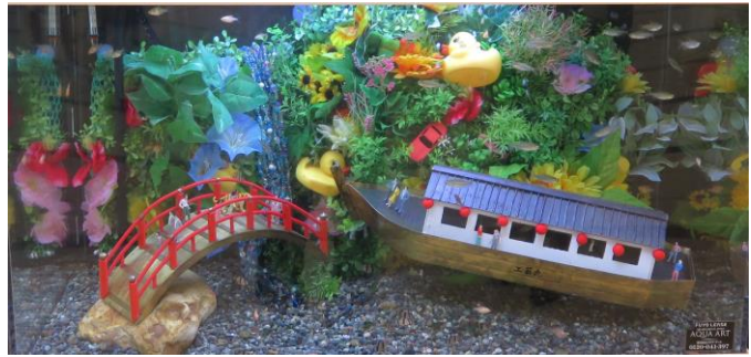
2018年度最優秀賞 受賞作品 『みっけ！ 工芸丸！』

今年も、日頃から魅力的な表現で「空間デザイン・デコレーション」作品を制作している東京都立工芸高等学校 アートクラフト科、東京デザイナー学院 インテリアデザイン科、東京コミュニケーションアート専門学校 エコ・コミュニケーション科の学生の皆様に協力を依頼し実現いたします。