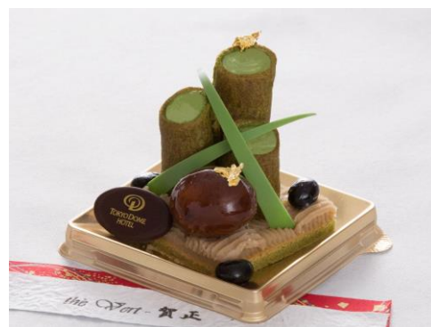
「The Vert 賀正」

抹茶のシュー生地には宇治抹茶のクリームと蜂蜜安納芋カスタードクリームを入れたエクレアを“竹”に見立てました。渋皮栗や黒豆をポイントとして、モンブランクリームを庭園の様にデコレーションして仕上げています。