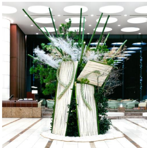
【参考】過去の展示作品