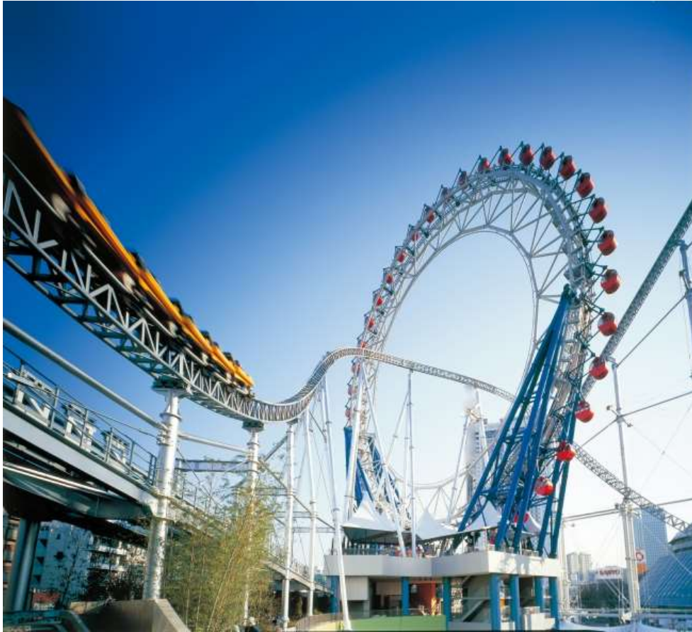
大人から子供まで楽しめる遊園地、東京ドームシティ アトラクションズ