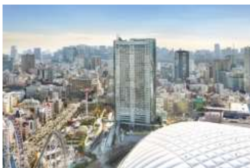
東京ドームホテル 外観

2000年6月1日開業。都心最大級のエンタテインメントエリア「東京ドームシティ」にそびえる高層ホテル。 丹下健三・都市・建築設計研究所（現：丹下都市建築設計）による建物は、力強い構造フレームと柔らかな曲面が印象的なモダンなデザイン。外装には、濃淡グレーのセラミックプレートと透過性と反射性を合わせもつガラスを使用し、刻々と表情を変えていく空や都市の景色を映し出している。地下3階、地上43階の高層ビルは、高さ155m、延床面積105,856.6㎡で、客室1,006室、レストラン&ラウンジ8店、大中小宴会場18室のほか、チャペル・神殿などの婚礼施設、屋外プールなどを備えている。