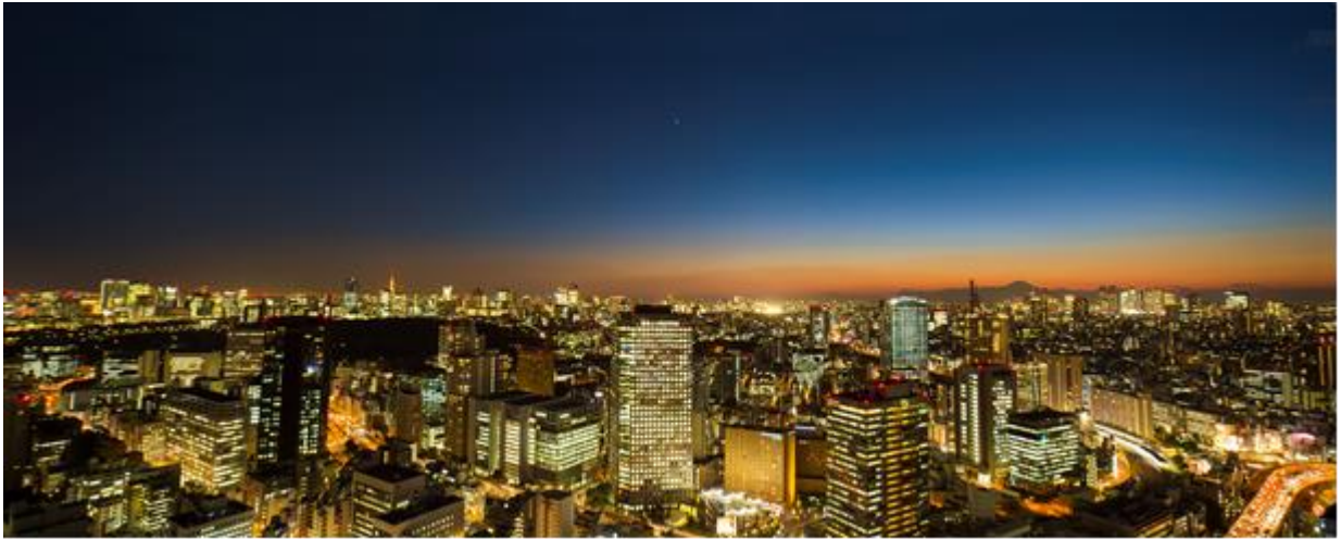
都内を見渡すパノラマ絶景！

8月は、特別にご宿泊者様限定で42Fを展望ルームとして開放いたします。地上140mからの東京の絶景をウェルカムドリンク(スパークリングワイン または ソフトドリンク)と共にお楽しみください。