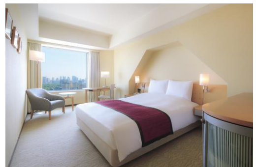
スタンダードダブルルーム