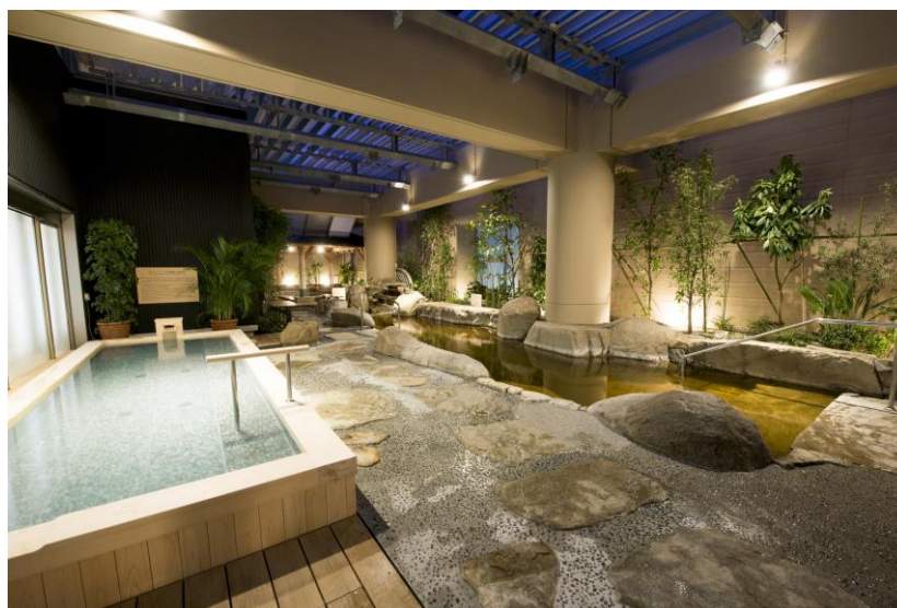
極上の癒しをご提供する天然温泉、スパ ラクーア