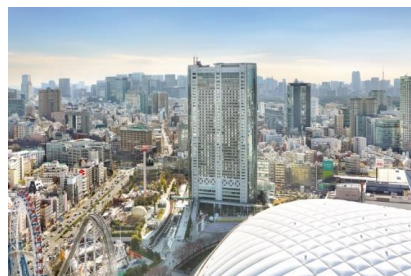
東京ドームホテル 外観

2000年6月1日開業。都心最大級のエンタテインメントエリア「東京ドームシティ」にそびえる高層ホテル。丹下健三・都市・建築設計研究所（現：丹下都市建築設計）による建物は、力強い構造フレームと柔らかな曲面が印象的なモダンなデザイン。外装には、濃淡グレーのセラミックプレートと透過性と反射性を合わせもつガラスを使用し、刻々と表情を変えていく空や都市の景色を映し出している。地下3階、地上43階の高層ビルは、高さ155m、延床面積105,856.6㎡で、客室1,006室、レストラン&ラウンジ8店、大中小宴会場18室のほか、チャペル・神殿などの婚礼施設、屋外プールなどを備えている。