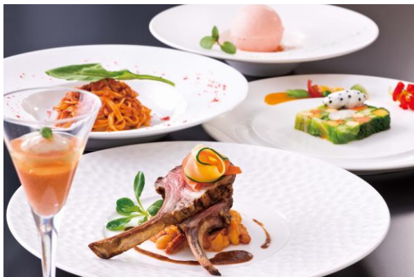
彩り豊かなイタリア料理のディナーコース（イメージ）

(1)最上階（43F）サウンドステージ&ダイニング「アーティスト カフェ」のコース料理 夜景と共に華やかなディナーコースはカップルにおすすめ！