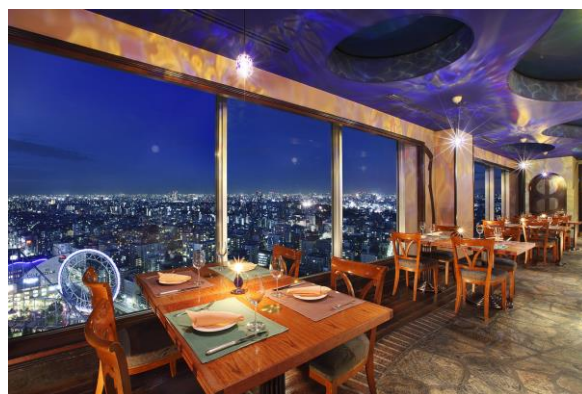
サウンドステージ&ダイニング「アーティスト カフェ」 店内イメージ