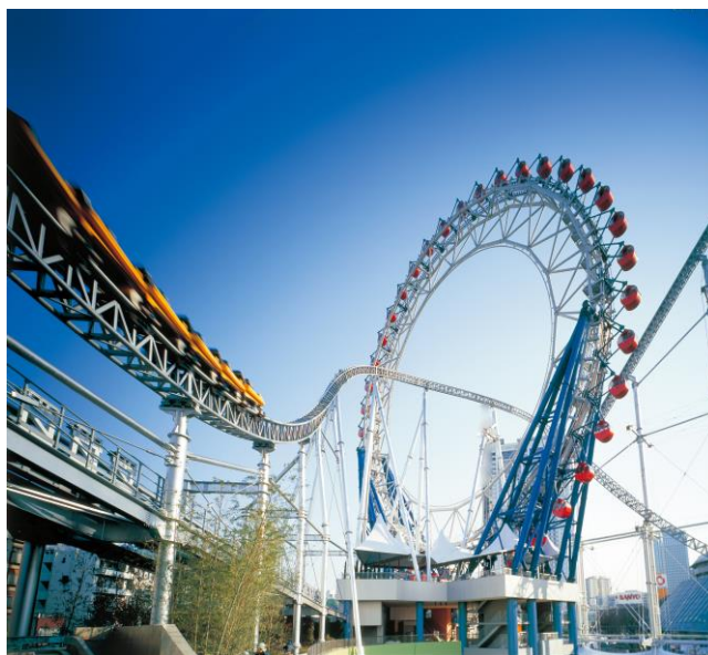
大人から子供まで楽しめる遊園地、東京ドームシティ アトラクションズ