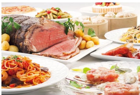
ローストビーフを中心とした洋食・中華・和食・スイーツ のbuffet料理（イメージ）

大人から子供までみなさまでお好きなものをお好きなだけ楽しめるリラッサはご家族におすすめ！ シェフが目の前でお取り分けするお料理をはじめ、バラエティ豊かなbuffetスタイルをお楽しみいただけます。※感染拡大防止対策による安全なお料理の提供スタイルに変更しております。