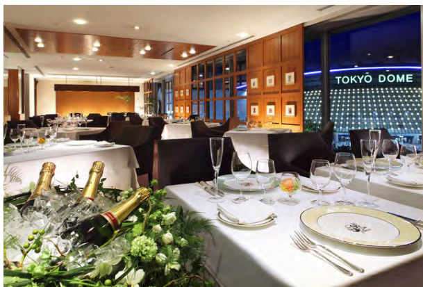
ダイニング「ドゥ ミル」

東京都の Go To トラベルキャンペーン除外が解除されてもなお、海外へのハネムーンの計画が立てられないなか、東京ドームホテルは「ハネムーンを諦めないで！新婚カップル応援ステイプラン」でおふたりの思い出作りのお手伝いをさせていただきます。高級感のある広々としたスイートルームでのご宿泊、メインダイニングでの本格フレンチと特別なおもてなし、翌朝お部屋での優雅なご朝食など、安心で快適な非日常空間を1日1組限定でおふたりのためだけの特別な1日を演出いたします。