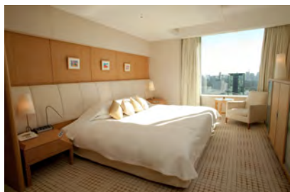
客室（パレススイート・ベッドルーム）