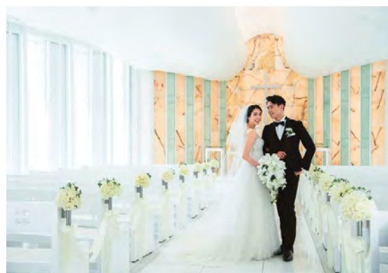
幸せの瞬間を1枚に！

まだ結婚式を挙げていない、ウェディングフォトを撮影していないおふたりには、本宿泊プラン専用のオプションフォトプランを通常料金より約68%引きの特別料金でご用意いたしました。ドレス・タキシードを着て、おふたりの“幸せな瞬間”を記念の1枚に。