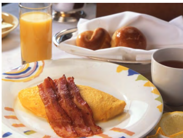
アメリカンブレックファストイメージ