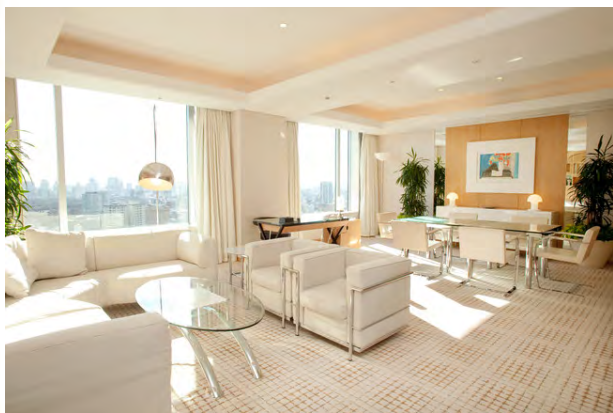
客室（パレススイート・リビングルーム）

東京ドームホテル（所在地：東京都文京区後楽 1-3-61、代表取締役社長 総支配人：大川大作）では、Go To トラベルキャンペーン対象「ハネムーンを諦めないで！新婚カップル応援ステイプラン」を販売いたします。ご予約は観光庁による Go To トラベルキャンペーン割引予約の受付解禁の発表があり次第、開始いたします。