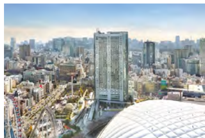
東京ドームホテル 外観

丹下健三・都市・建築設計研究所（現：丹下都市建築設計）による建物は、力強い構造フレームと柔らかな曲面が印象的なモダンなデザイン。外装には、濃淡グレーのセラミックプレートと透過性と反射性を合わせもつガラスを使用し、刻々と表情を変えていく空や都市の景色を映し出している。地下3階、地上43階の高層ビルは、高さ155m、延床面積105,856.6㎡で、客室1,006室、レストラン&ラウンジ8店、大中小宴会場18室のほか、チャペル・神殿などの婚礼施設、屋外プールなどを備えている。