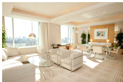
客室（パレススイート・リビングルーム）