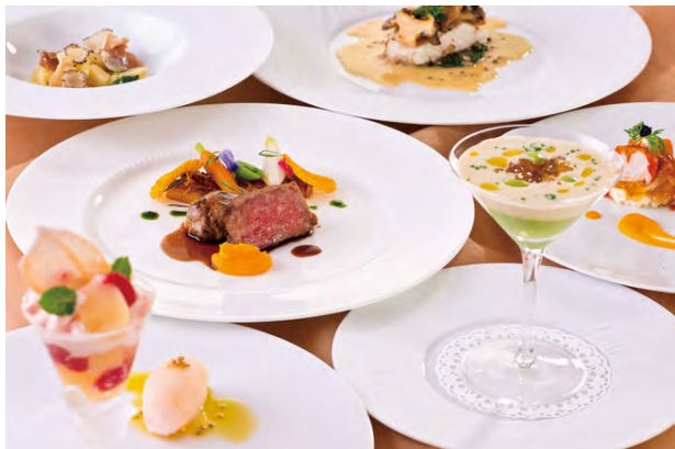
ディナーコースイメージ