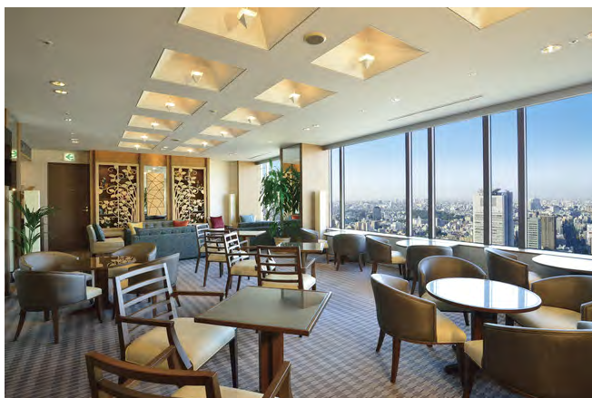
エクセレンシラウンジ

都心の摩天楼や緑豊かな皇居の景色を一望でき、白を基調としたイタリアンモダンテイストにまとめたパレススイート。バスルームには白い大理石を用い、窓側のジャクジーから望む夜景も抜群です。また、ダークブラウンの木目を基調とした落ち着いたインテリアのパークスイートでは、東京ドームシティはもちろん、閑静な東京を象徴するような上野、谷中の緑あふれる風景など関東平野を一望することができます。優雅な空間がおふたりだけの特別な時間を演出します。