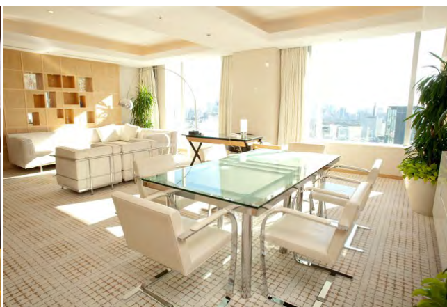
客室 (パレススイート・リビングルーム)

1日のはじまりは、ルームサービスでおふたりだけのリッチなご朝食を。行き届いたサービスでお部屋まで温かいお料理をお届けいたします。卵料理やサイドディッシュ、トーストなどを揃えたアメリカンブレックファストを、ふたりきりで味わう優雅なひとときに。