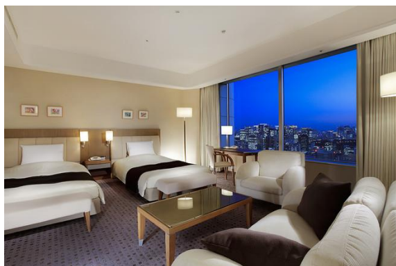
客室例：エクセレンシスイート

本プランでは、高層階に位置するエクセレンシフロアにもご宿泊が可能です。ハイグレードなお部屋で最上の寛ぎのひとときをお過ごしください。