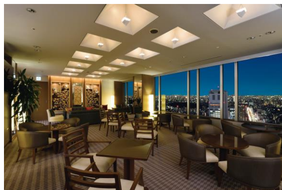
エクセレンシラウンジ

エクセレンシフロアにご宿泊のお客様にご利用いただける専用ラウンジ「エクセレンシラウンジ」では、チェックイン・チェックアウトのお手続きをしていただけるほか、軽食やドリンクサービスなどをご提供しております。