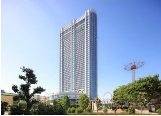
東京ドームホテル外観

地下3階、地上43階の高層ビルは、高さ155m、延床面積105,856.6㎡で、客室1,006室、レストラン&ラウンジ8店、大中小宴会場18室のほか、チャペル・神殿などの婚礼施設、屋外プールなどを備えています。