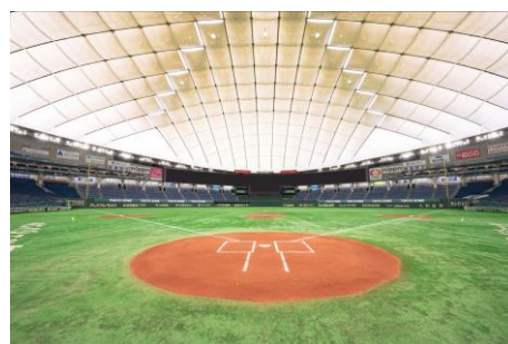
東京ドーム グラウンド