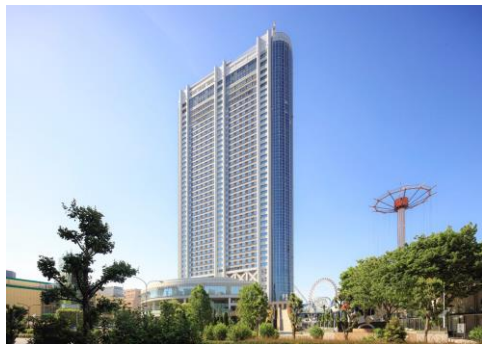
東京ドームホテル外観

地下3階、地上43階の高層ビルは、高さ155m、延床面積105,856.6㎡で、客室1,006室、レストラン&ラウンジ8店、大中小宴会場18室のほか、チャペル・神殿などの婚礼施設、屋外プールなどを備えています。