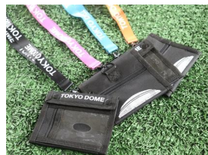
東京ドームツアー限定記念品「フラグメントケース」イメージ