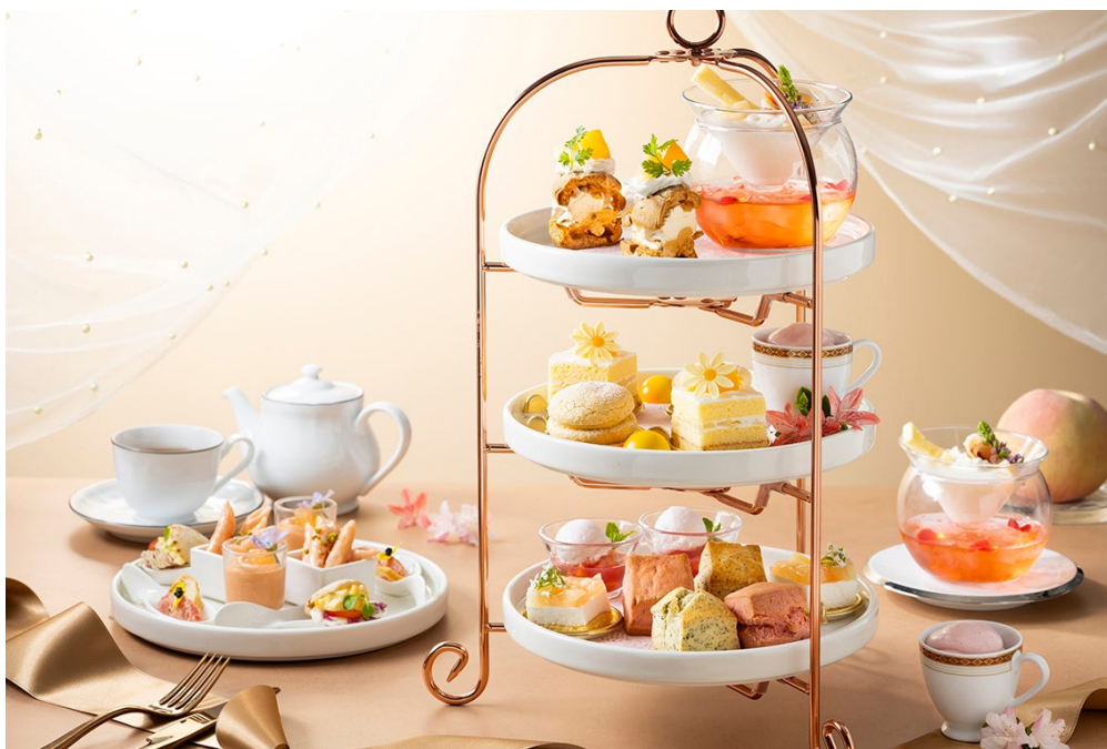
「ピーチアフタヌーンティー」(写真は2名様分イメージ)

関連情報 URL： https://www.tokyodome-hotels.co.jp/restaurants/fair/artistcafe-afternoontea/