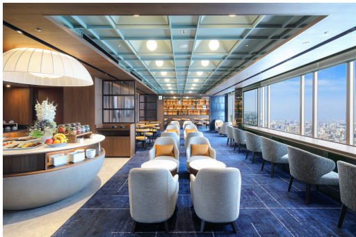
エグゼクティブラウンジ

料 金：1 泊 1 室 2 名様ご利用の場合 ￥206,000 ※室料・ご夕食・ご朝食・サービス料・諸税込み