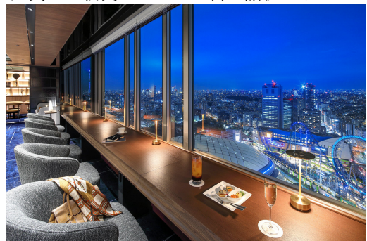
エグゼクティブラウンジ