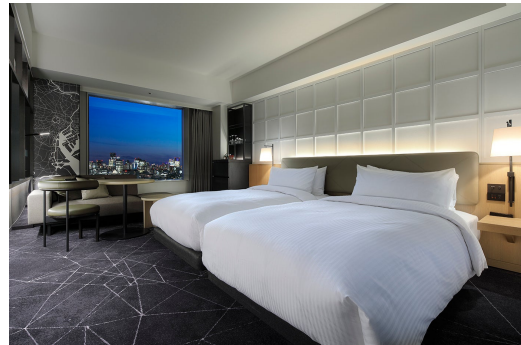
プレミアムルーム ツイン（バルコニーサイド）