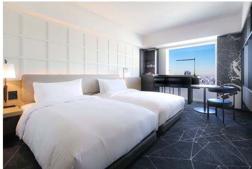
プレミアムルーム ツイン（パークサイド）

プレミアムフロアに位置する「プレミアムルーム」をお得にご利用いただける特別プランをご用意いたしました。本プランには、東京ドームシティでご利用いただけるチケット（1室2,000円分）付きとなっているため、お買い物やお食事などにご使用いただけます。