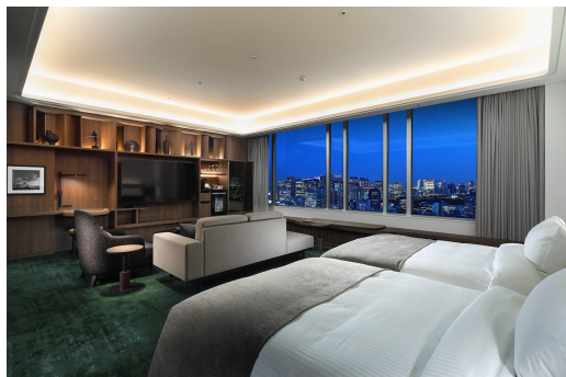
エグゼクティブスイート A

エグゼクティブフロアに位置する「エグゼクティブスイート」をお得にご利用いただける特別プランをご用意いたしました。対象はツインルームとなり、エグゼクティブラウンジをご滞在中ご利用いただけます。高層階に位置するスイートルームで、ゆっくりとお過ごしいただける宿泊プランです。