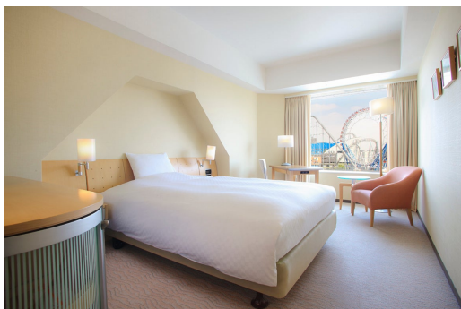
スタンダードシングルルーム

例：シングルルーム（26平米）のご予約をツインルーム（33平米）へご案内いたします。