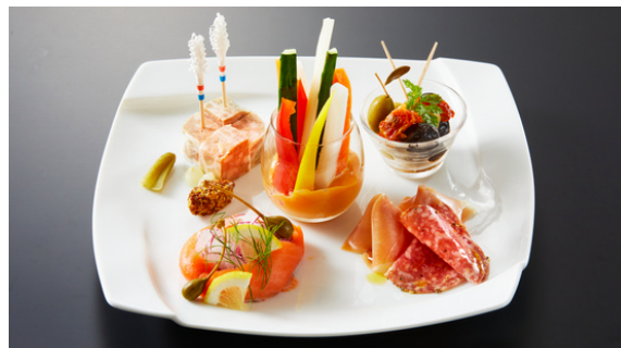
5種盛り合わせ (3種盛り合わせ+生ハム・ミックスオリーブ) Assorted 5 Kinds of Appetizer

※表示料金はサービス料・消費税込みの料金です。写真はイメージです。 *The prices include service charge and tax. The photo is for illustrative purposes only.