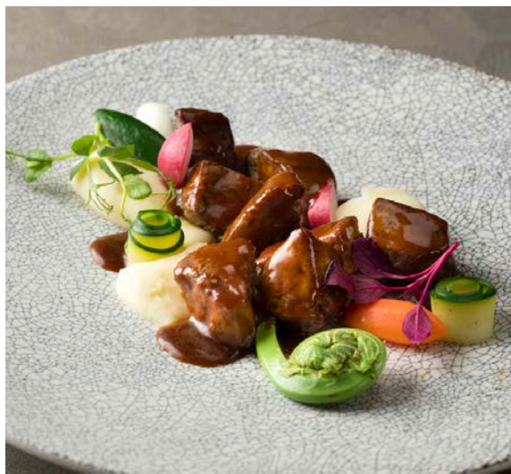
牛フィレ肉のサイコロステーキ Diced Fillet Steak

※表示料金はサービス料・消費税込みの料金です。写真はイメージです。 *The prices include service charge and tax. The photo is for illustrative purposes only.