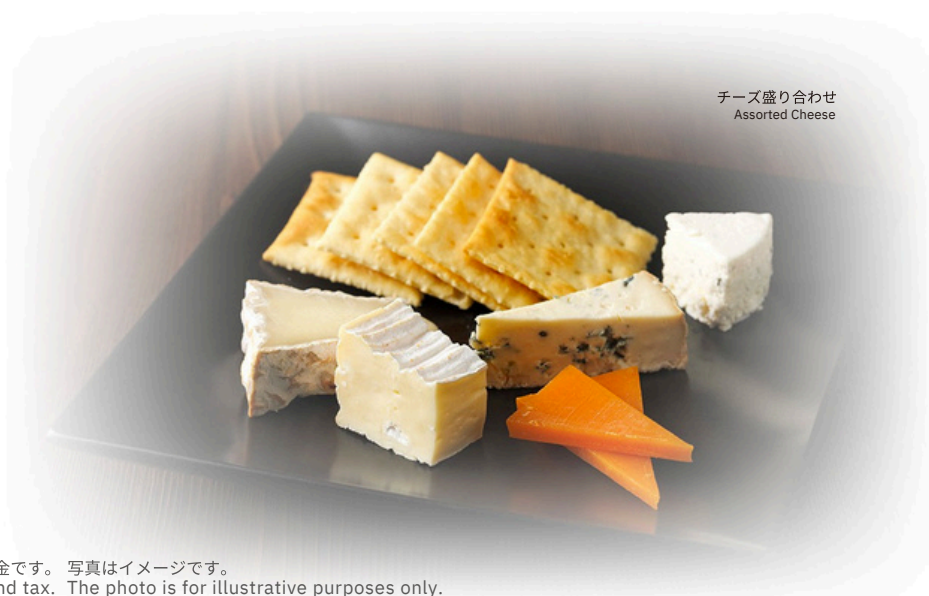
チーズ盛り合わせ Assorted Cheese

※表示料金はサービス料・消費税込みの料金です。写真はイメージです。 *The prices include service charge and tax. The photo is for illustrative purposes only.