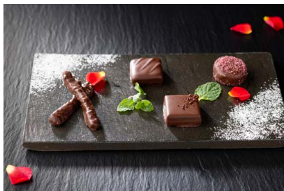
フランス産チョコレートの盛り合わせ French Chocolates

ミックスオリーブとドライトマト ..... ¥1,600 Assorted Olives with Dried Tomatoes