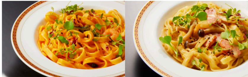
エビ トマトクリーム Shrimp Tomato Cream